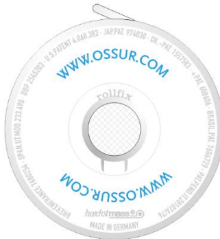
Druckknopfseite press-button side