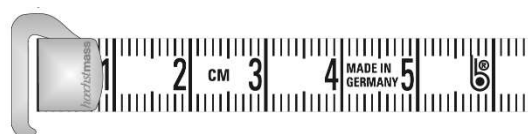
Hakenbeschlag hook attachment