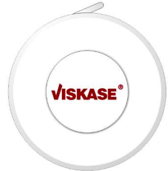
Druck Platine print center disc