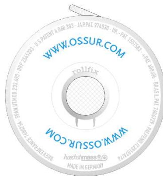
Druckknopfseite press-button side