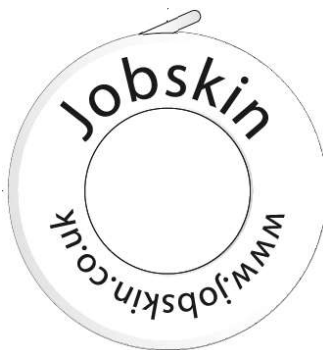
Platinenseite center disc side